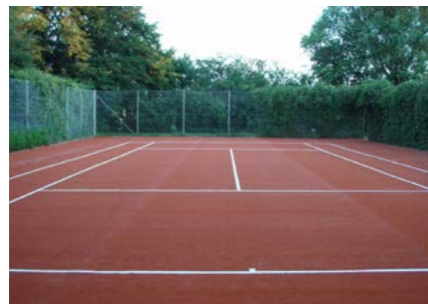
Øverst en kunstgræsbane og nederst ses en Red Brick Clay-bane.