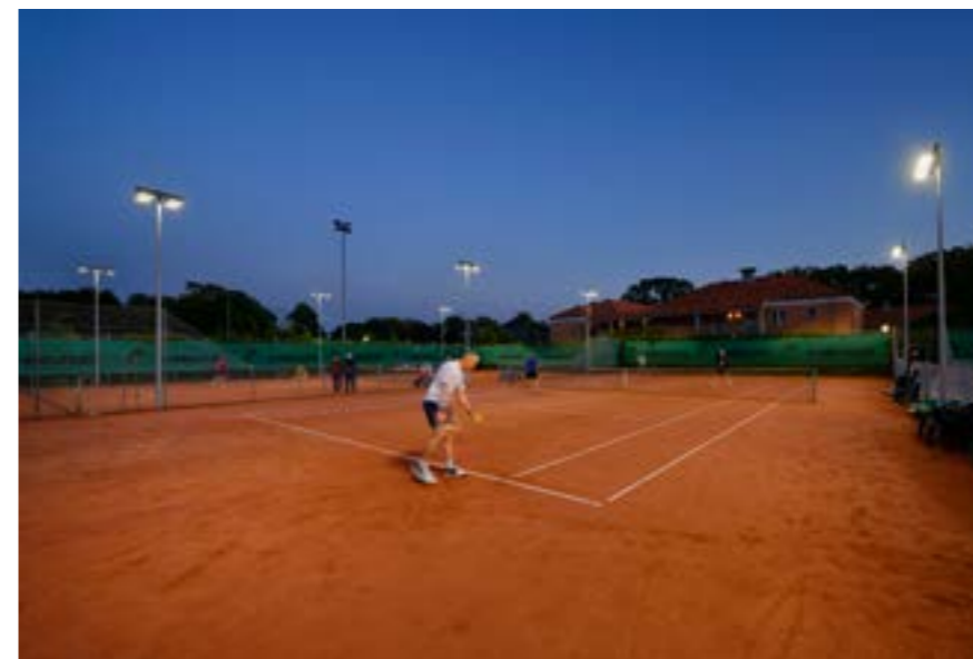
Udendørsbelysning i Sorø Tennisforening.

Telefon: +45 88 72 88 00 Mail: info@lite-led.dk