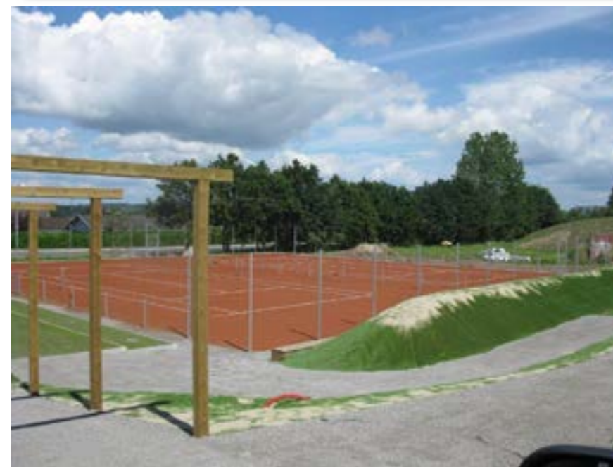
På billederne ses Tåsinge Tennispark, som åbnede i 2012.

HP Tennisanlæg Tingstedvej 29 4350 Ugerløse